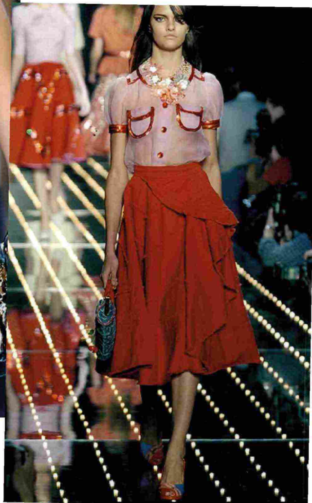
Sfilata Louis Vuitton, Primavera-Estate 2005

U n viaggio visivo nell'estetica di un'epoca che ha lasciato il segno. A Pescia (Pistoia), tra le mura di un ex laboratorio del marmo oggi sede della Fondazione Poma, dal 1° al 30 marzo va in scena Y2K. Il termine, abbreviazione di Year 2000, non indica solo il celebre problema informatico legato al cambio di millennio, ma è diventato sinonimo delle tendenze che hanno definito quegli anni, tra sperimentazione digitale, eccessi cromatici e innovazione nei materiali. In mostra oltre 10mila fotografie attraverso cui rivivere le sfilate di moda di quegli anni e